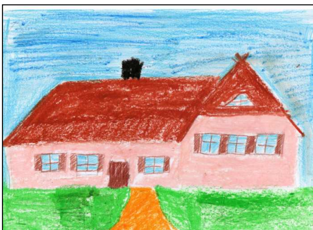
Dworek w Będominie

Muzeum Hymnu Narodowego w Będominie mieści się w barokowym dworku w którym urodził się twórca Mazurka Dąbrowskiego – Józef Wybicki.