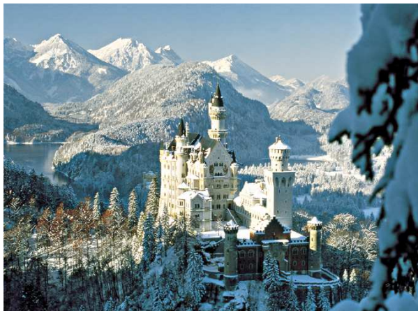
Zamek Neuschwanstein - zimą

Marzenia wcale nie oddalają nas od rzeczywistości, ale ją przybliżają i czynią łatwiejszą do zniesienia. Żeby nie wielcy marzyciele nie bylibyśmy dzisiaj w kosmosie i nie było by tych wielu wspaniałych rzeczy, które nas otaczają. Ja też mam wiele marzeń. Niektóre z nich są bardzo osobiste. Ale jedno z nich dotyczy właśnie podróży. Chciałabym zobaczyć zamek, o którym mówi się „bajkowy zamek”. Jest on tak baśniowo piękny, że Walt Disney wzorował na nim zamek śpiącej królowej i ostatecznie przyjął wizerunek zamku na logo swojej wytwórni filmowej. Znajduje się on w Alpach Bawarskich i nazywa się Neuschwanstein - Nowy Łabędzi Kamień. Zbudował go i mieszkał w nim król, którego nie rozumiał świat. Król ten kochał poezję i muzykę, szczególnie muzykę Wagnera, z którym się przyjaźnił. Moim marzeniem jest wysłuchać koncertu wagnerowskiego w sali śpiewaków zamku z baśni.