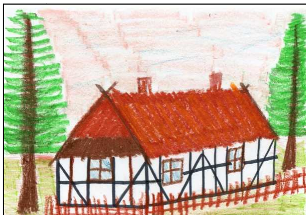
Skansen w Klukach