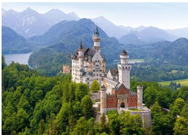
Zamek Neuschwanstein – wiosną.